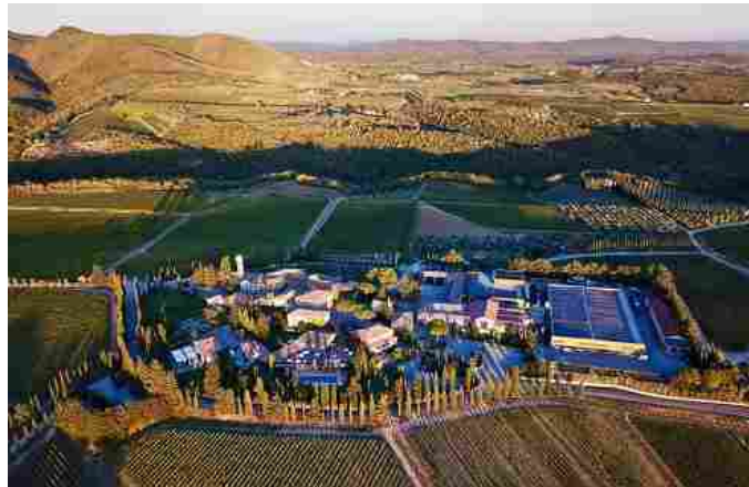
(Borgo San Felice di Castelnuovo Berardenga)

si potrà assistere ai lavori con trazione animale in vigna con cavalli. Saranno allestite postazioni dove degustare Chianti Classico e diversi truck-food con specialità locali.